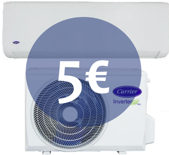
1 sistema MONOSPLIT CLEVER