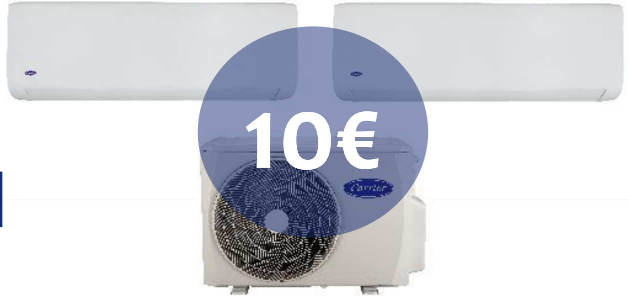
1 sistema DUALSPLIT CON 2 UNITÀ INTERNE di qualsiasi tipo